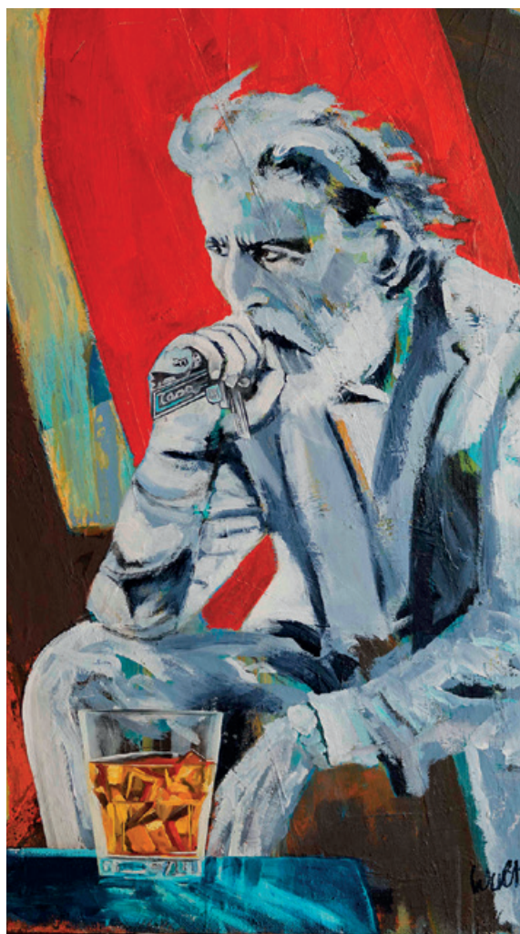
"go home" 134,5 x 89,5 cm Mischtechnik, Acryl / Öl auf Jute, 2021 (Ausschnitt)

Wir freuen uns auf Ihr/Euer Kommen! U.A.w.g. bis 25.10.23